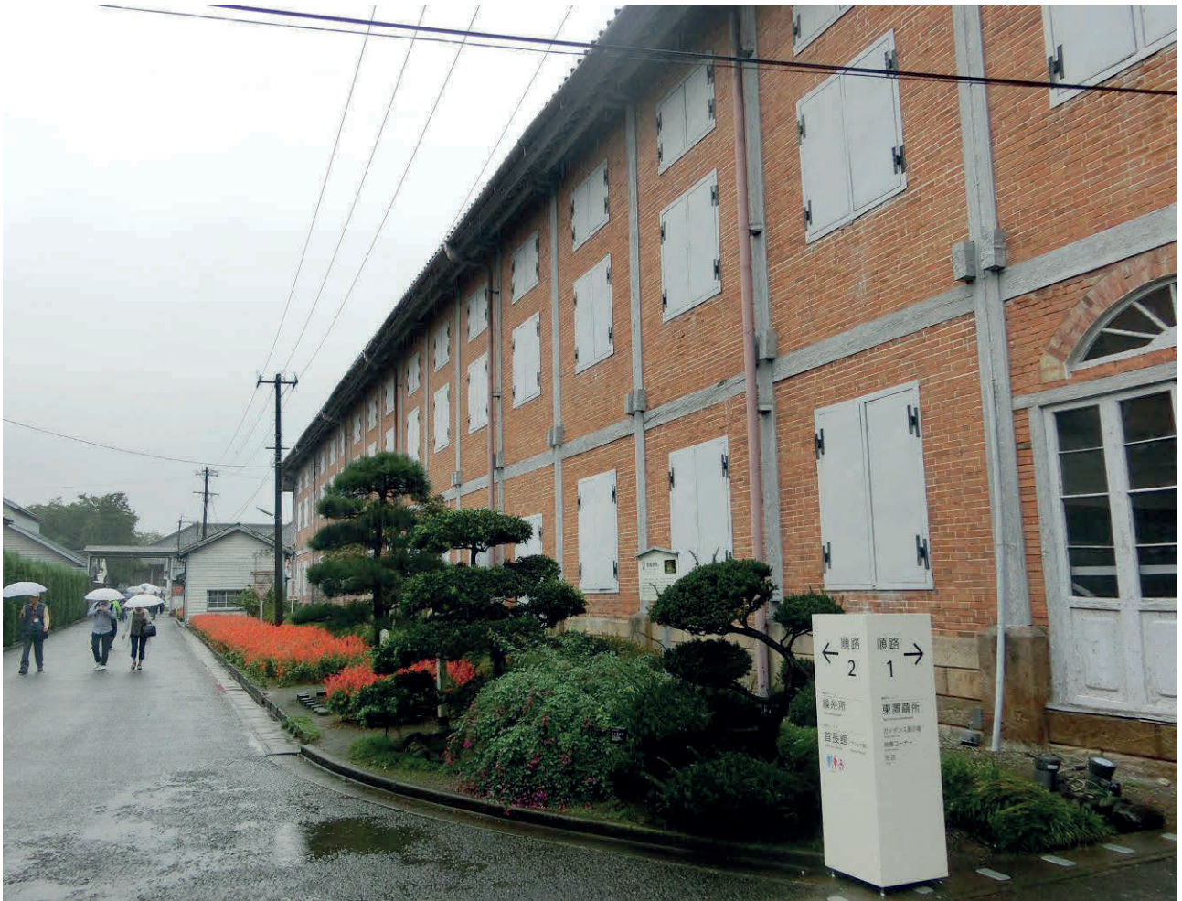
▲ 富岡製糸場：写真提供デジカメ同好会・市川洋子