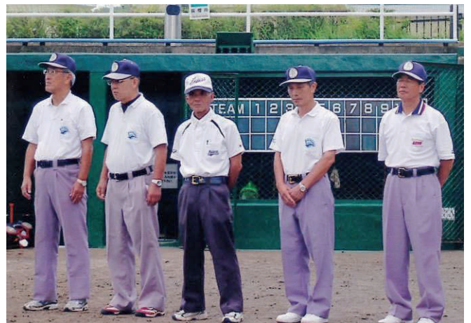
▲ 審判員(鎌倉市野球協会)左端:筆者

それから 10 年、プレーは仲間が少しずつ減ってチームを維持するのが不可能となり、大会参加はやめました。毎年 1 回情報総研メンバー(現在の菱船会野球部として、鎌倉市の大会に参加している)と野球を楽しんでいます。